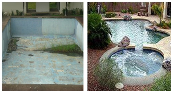
Al área de piscina se le realizarán modificaciones como: cambiarle la forma, detalles en piedras, agregarle jardín, zonas verdes, sillas reclinables para piscina, iluminación e instalación de una nueva bomba de agua.