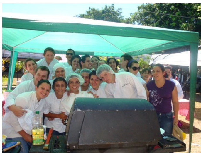
Fotografías que evidencian las actividades realizadas.