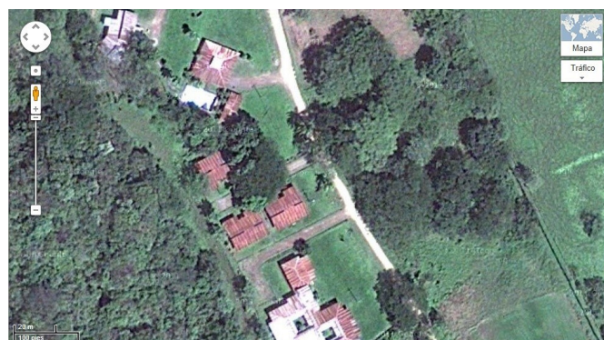
Reserva forestal Taboga, costado sur de la reserva, donde se ubicaría el Proyecto.