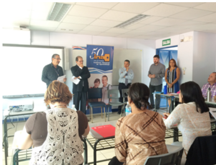
Inauguración del taller

Al final de la actividad se expusieron los diferentes proyectos elaborados por los participantes y de esta manera se pudo apreciar los diversos formatos culturales aplicados en la producción audiovisual educativa.