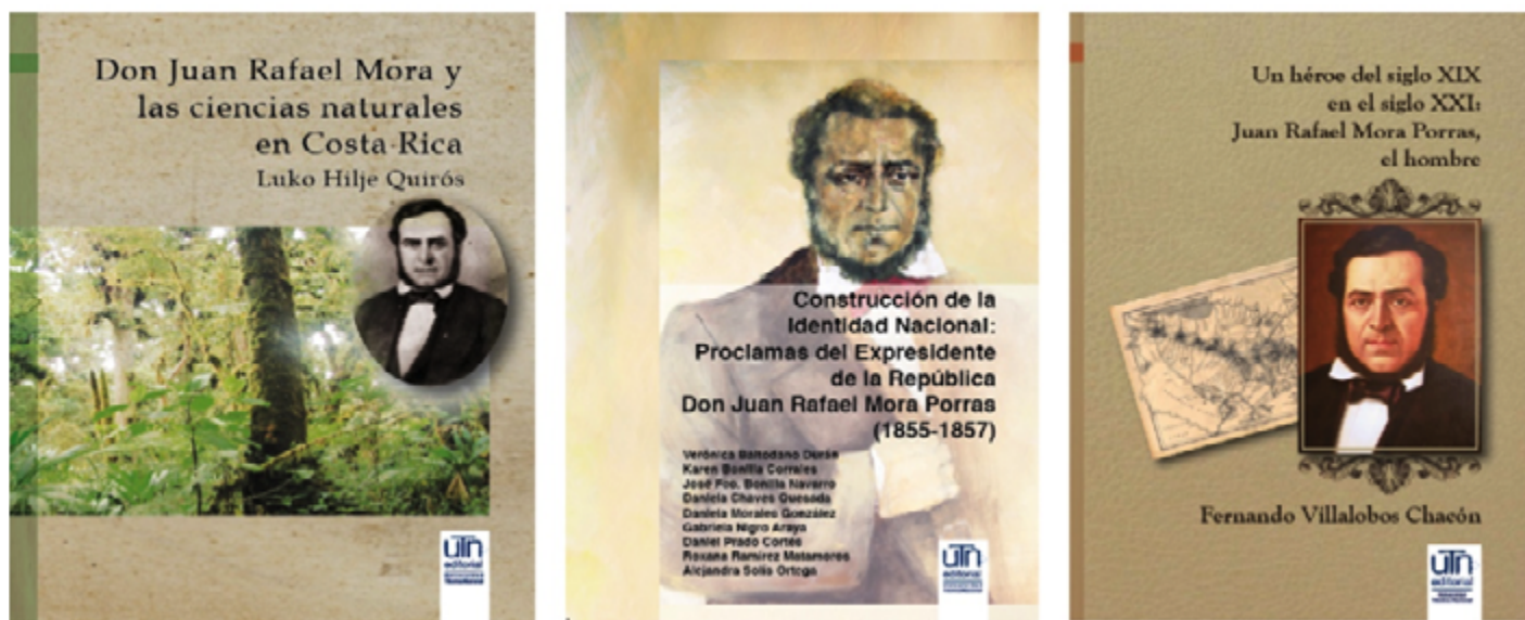
3 publicaciones alusivas a Juan Rafael Mora Porras con sello UTN