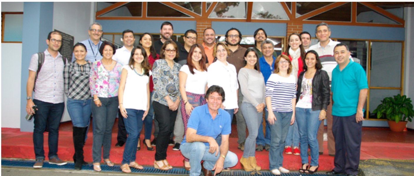
Instructor y participantes del Taller Guión Creativo

Funcionarios del Área de Tecnología Educativa y Producción de Recursos Didácticos del Centro de Formación Pedagógica y Tecnología Educativa de la Universidad Técnica Nacional, participaron del 09 al 13 de noviembre, en el Taller “Creación de Guión Creativo, Formatos Culturales” brindado por el Instituto Nacional de Aprendizaje (INA), gracias al convenio y excelentes relaciones que existe entre la UTN y el INA. En esta actividad se contó, además, con la participación de funcionarios del Instituto Nacional de Aprendizaje, Sistema Nacional de Radio y Televisión, Universidad Estatal a Distancia y de la Universidad de Costa Rica.