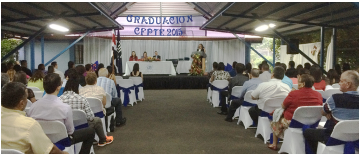
Graduación Sede de Alajuela