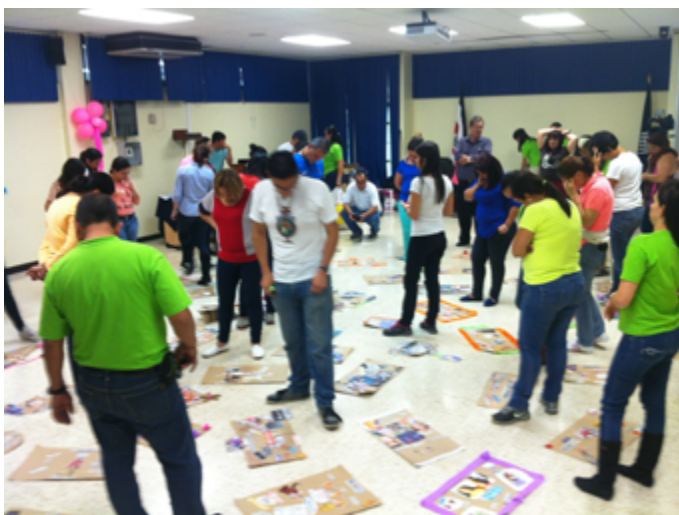
Desarrollo del Taller de Pedagogía Lúdica

Como parte de esta experiencia, el Área de Formación Pedagógica planifica para el próximo año, la elaboración de un taller de Pedagogía Lúdica para los académicos de la Universidad, con el propósito de fomentar la innovación en sus procesos de aprendizaje.