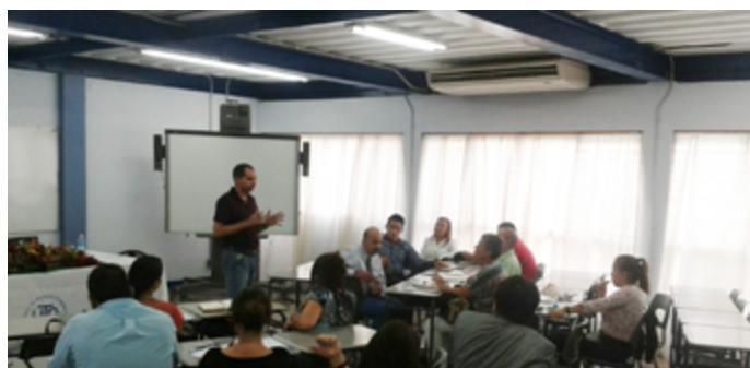
Participantes en el taller Comunidades Aprendientes

"Si vivimos una cultura centrada en la competencia que justifica la negación del otro arguyendo la legítima superioridad del vencedor y la legítima inferioridad del perdedor, ¿cómo es que podemos apreciar y desear un vivir utópico en la colaboración y en el respeto por el otro?" (Maturana, 1992, p.88)*