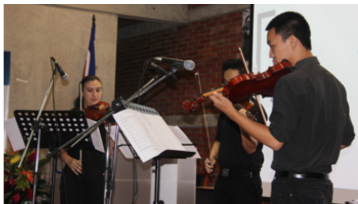
Acto cultural a cargo del Trío de violines de la UTN