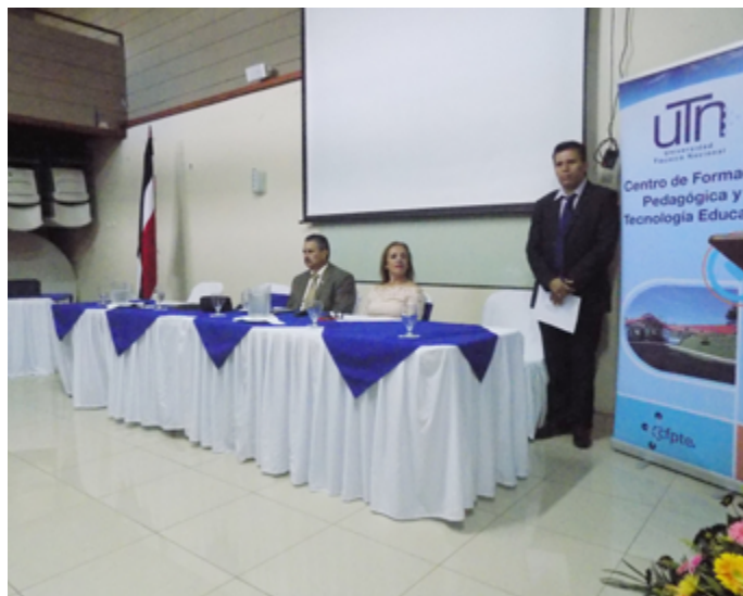
Graduación Sede de San Carlos