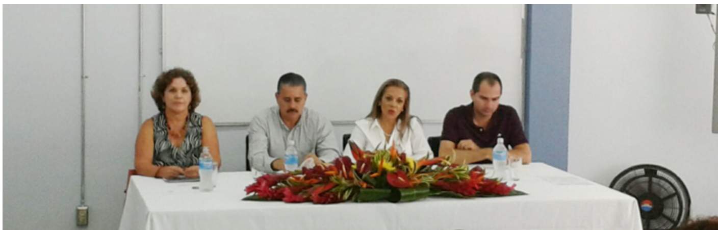
Taller "Comunidades aprendientes"