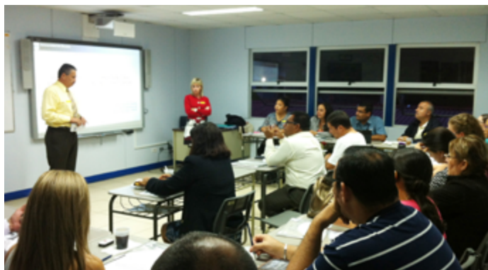
Taller Desarrollo de Competencias en la Educación Superior