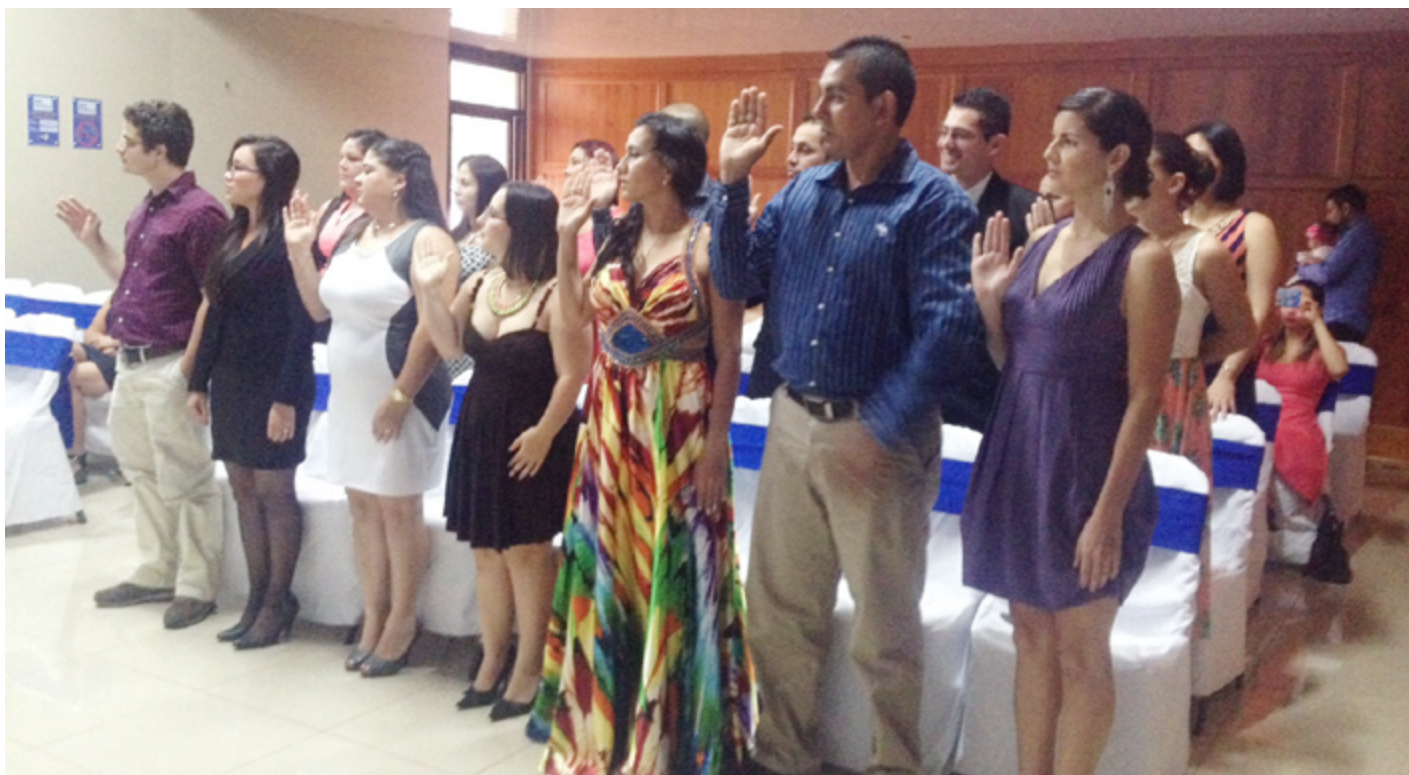
Graduandos Sede de San Carlos