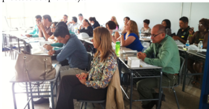
Conversatorio Competencias en la Educación Superior