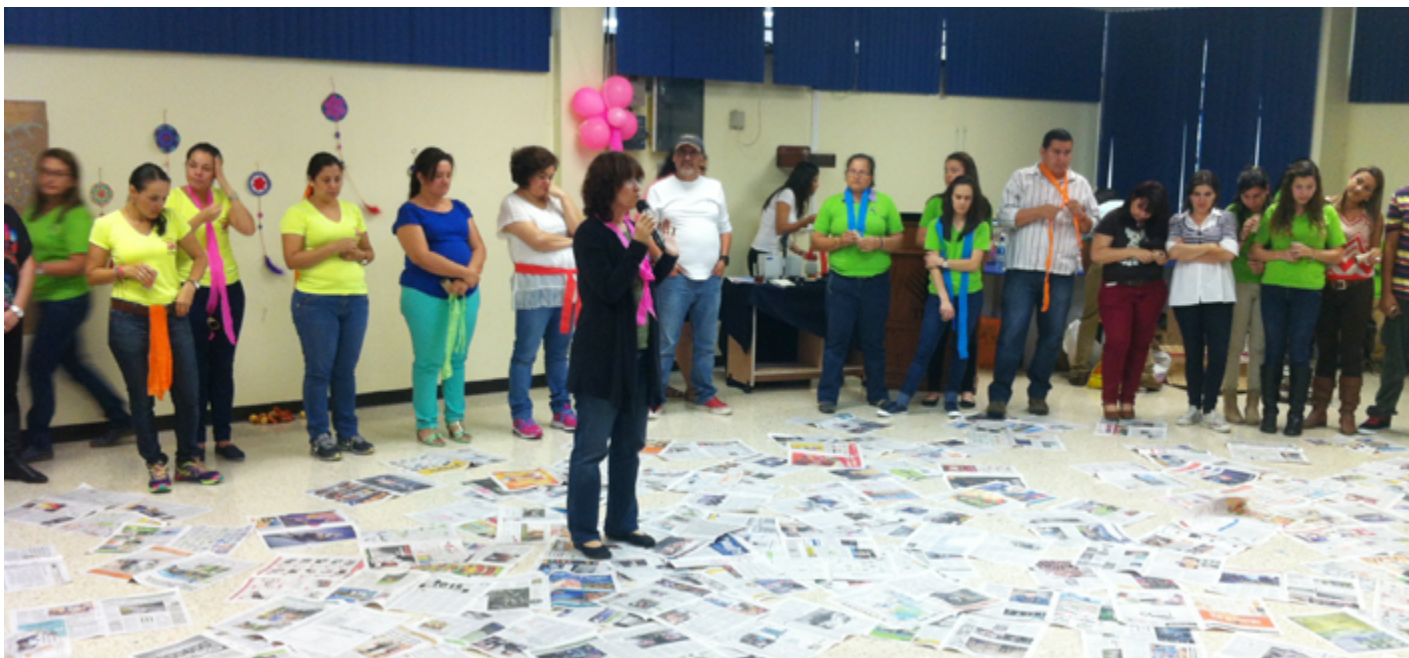
Participantes del taller