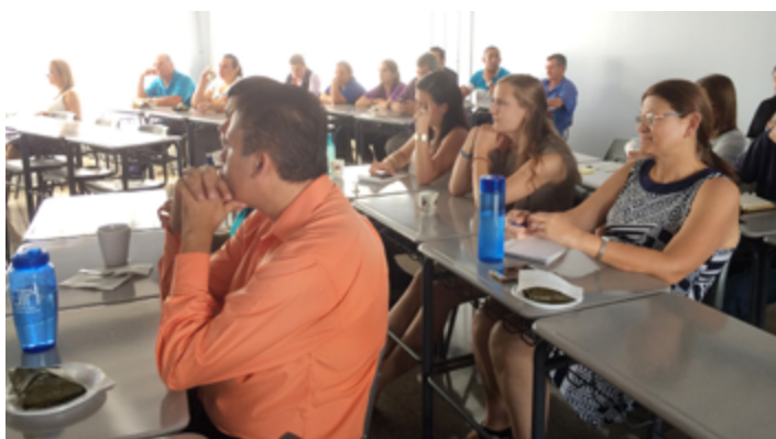
Funcionarios del CFPTE recibiendo la charla

Además, se dio énfasis en una convivencia basada en el respeto de los derechos y valores de cada individuo, la necesidad de buscar un trato igualitario de todos los miembros de la sociedad respetando la diversidad y particularidades culturales, étnicas, religiosas, políticas, entre otras.