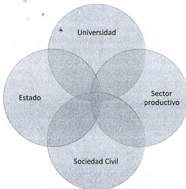
Figura 2: Modelo Vinculatorio Universidad Economía y Sociedad.

A lo externo, la Vicerrectoría de Extensión y Acción Social representa un modelo de interacción en el que participan el Estado, el Sector productivo y la Sociedad Civil.